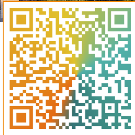
—— 山大人 —— 公众 号