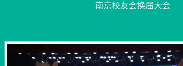
南京校友会换届大会