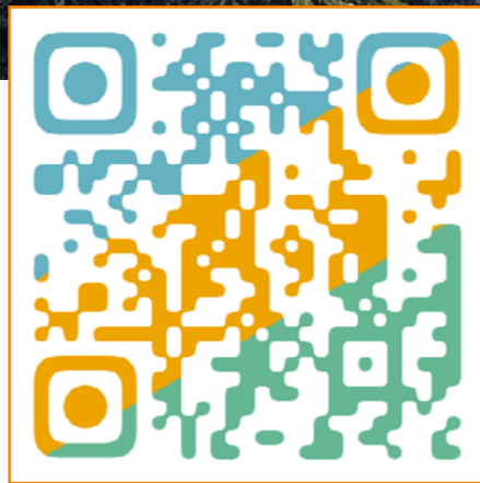
—— 扫描二维码 —— 进入山东大学校友网