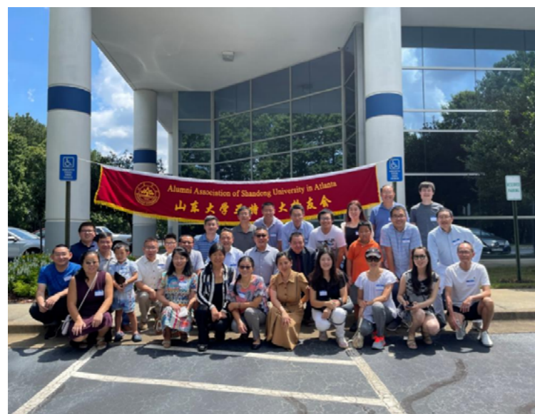
亚特兰大校友会 聚会活动