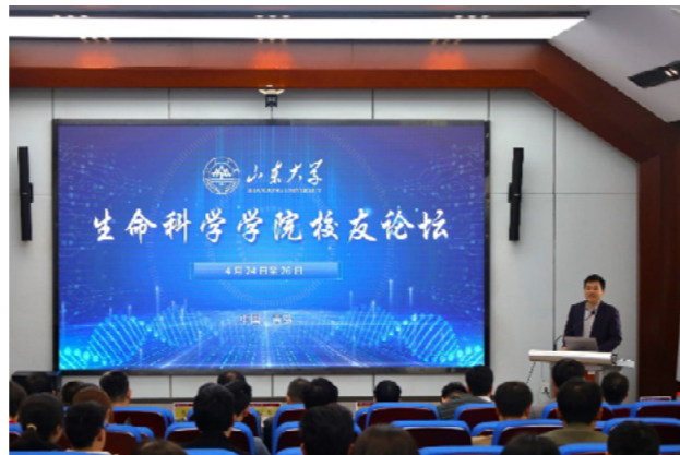
生命科学学院校友论坛