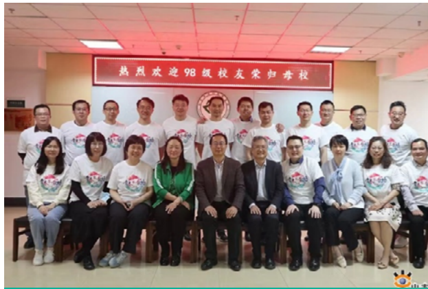
口腔医学院校友聚会活动