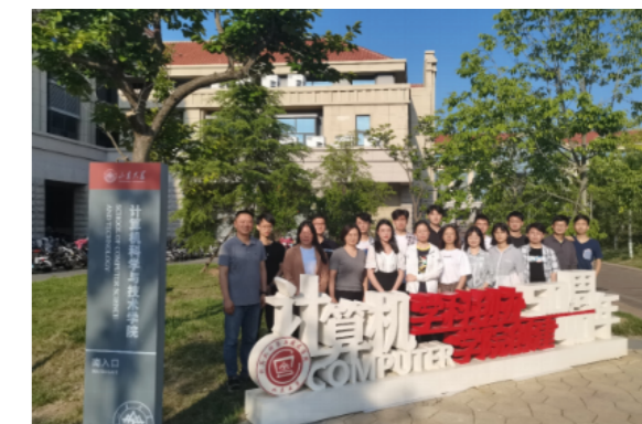
计算机科学与技术学院班级理事

学校每年面向毕业班级聘任校友班级理事。班级理事主要负责联络本班同学，及时传达母校和校友会信息，协助校友会组织各项活动，增强校友与母校的感情。