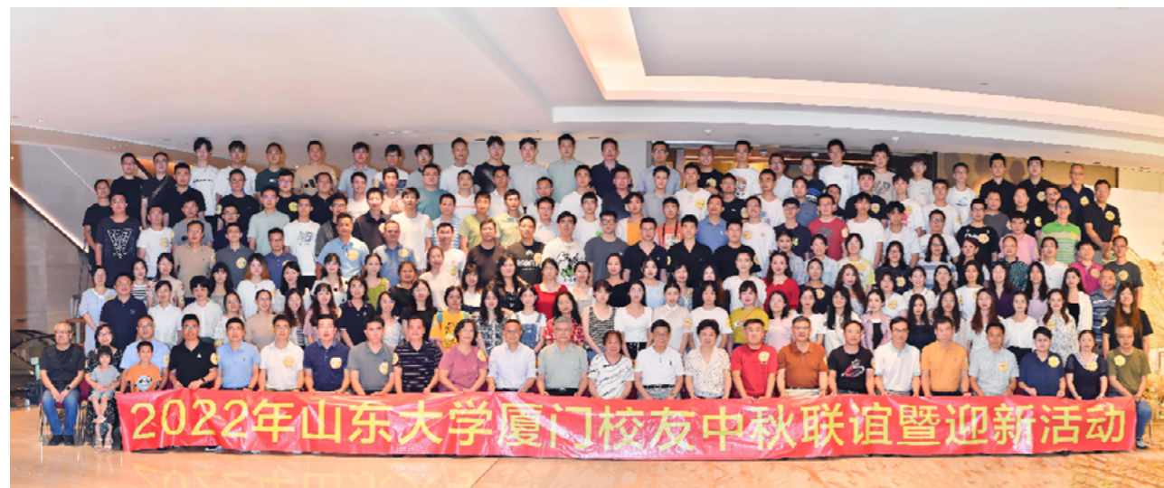
厦门校友会 联谊活动