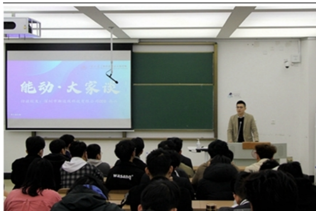
能动学院举办“能动·大家谈”校友专访活动