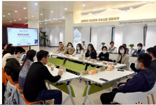
经济学院聚贤校友讲坛