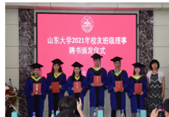
土建与水利学院班级理事